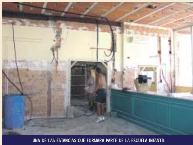
UNA DE LAS ESTANCIAS QUE FORMARÁ PARTE DE LA ESCUELA INFANTIL

Al mismo tiempo que se desarrollan estas obras, en la zona más antigua de la Escuela Infantil se ha procedido a pintar todas las paredes. Por tal motivo, el servicio de guardería que suele ofrecerse cada verano se desarrolló del 2 al 27 de julio, cerrando, a partir de esta última fecha, las instalaciones para llevar a cabo todas las mejoras, ya que la intención es que, de transcurrir todo tal y como se ha previsto, para el próximo curso escolar 2007/2008, la