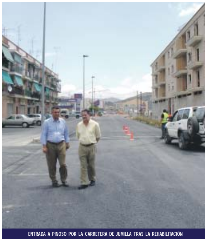
ENTRADA A PINOSO POR LA CARRETERA DE JUMILLA TRAS LA REHABILITACIÓN

Otra de las zonas en las que se ha actuado ha sido el camino de subida al paraje del Monte Cabezo, eliminando los peraltes en el firme originados por las raíces de los pinos y que dificultaban el tráfico de vehículos. Una actuación de urgencia que da respuesta a la demanda vecinal, que había manifestado sus quejas por el estado en que se encontraba el principal acceso al paraje, y que mejoró su aspecto antes que llegaran sus fiestas.