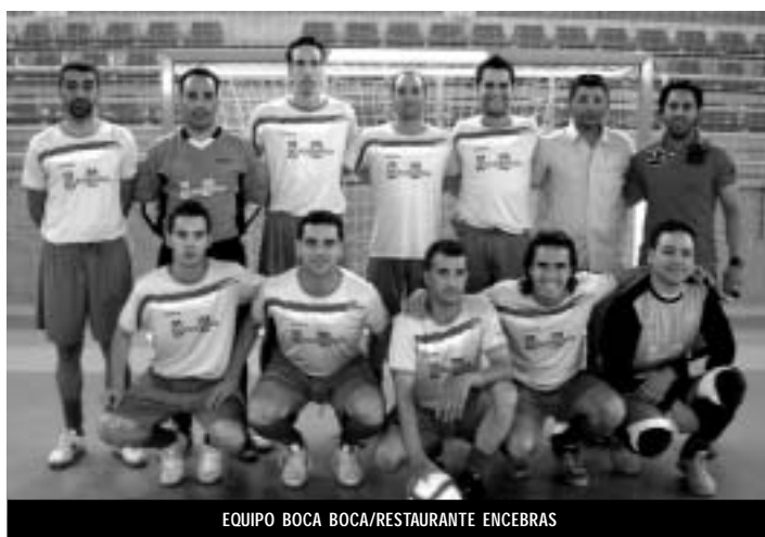
EQUIPO BOCA BOCA/RESTAURANTE ENCEBRAS