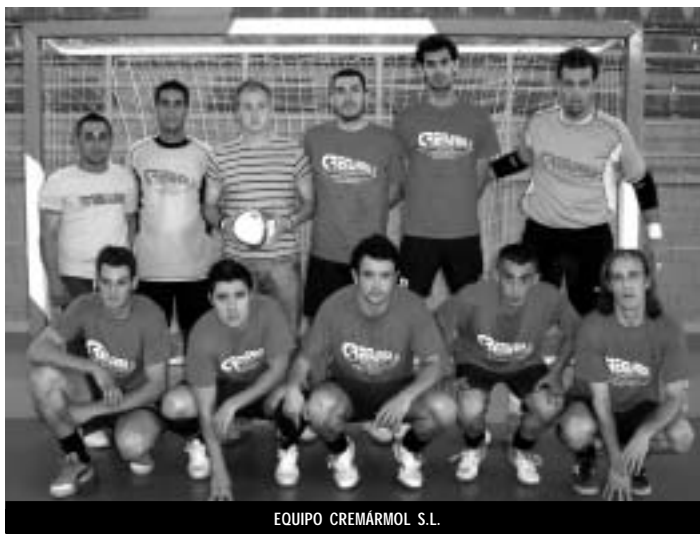
EQUIPO CREMÁRMOL S.L.