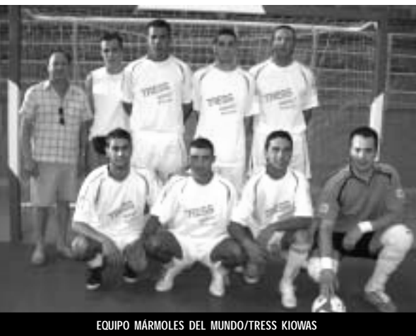
EQUIPO MÁRMOLES DEL MUNDO/TRESS KIOWAS