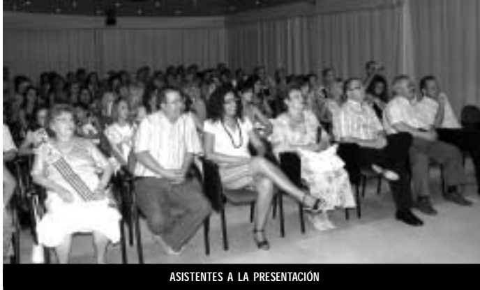
ASISTENTES A LA PRESENTACIÓN

El martes 17 de julio, en los días previos a la celebración de la Feria y Fiestas de Pinoso, se presentaba, en un acto celebrado en el Centro de Recursos "Casa del Vino", el programa oficial de festejos.