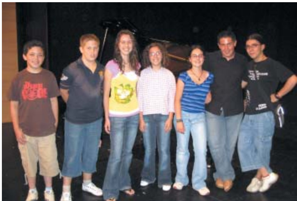
ALGUNOS DE LOS JÓVENES INTÉRPRETES QUE SE CLASIFICARON EN LA FASE LOCAL

El pasado 6 de julio, el Teatro Auditorio Municipal fue escenario de la fase local del 7º Certamen Comarcal de Interpretación Musical, tomando parte en el mismo un total de 20 músicos.