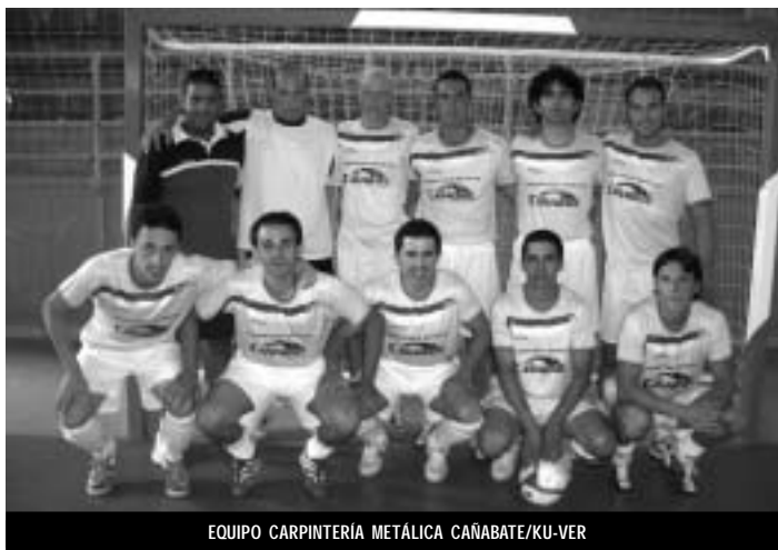
EQUIPO CARPINTERIA METÁLICA CAÑABATE/KU-VER