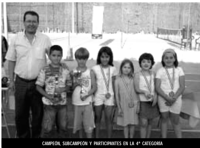
CAMPEÓN, SUBCAMPEÓN Y PARTICIPANTES EN LA 4ª CATEGORÍA