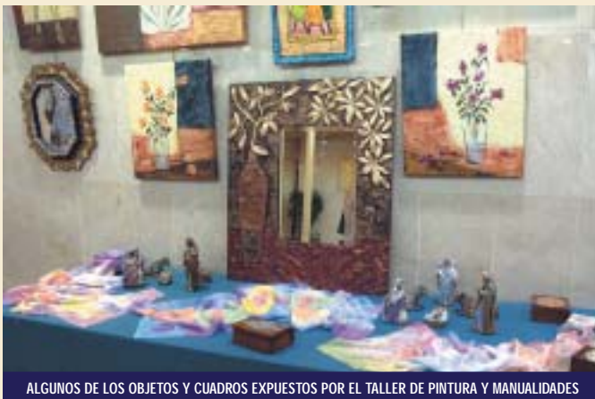
ALGUNOS DE LOS OBJETOS Y CUADROS EXPUESTOS POR EL TALLER DE PINTURA Y MANUALIDADES