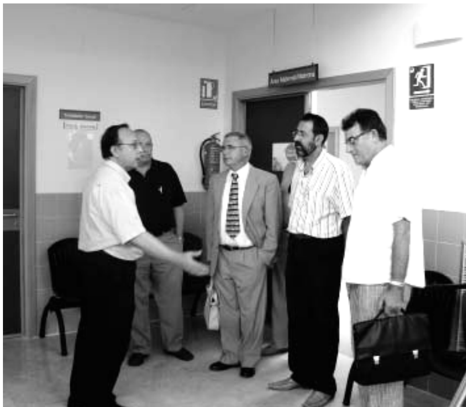
LOS MIEMBROS DEL CONSEJO DE SALUD VISITARON LAS INSTALACIONES SANITARIAS DE PINOSO

El motivo principal de reunirlos en Pinoso, según apuntó el Concejal de Sanidad, fue convencer a sus miembros de la necesidad de que Pinoso cuente con el Centro Integral de Especialidades, y que los especialistas sanitarios se desplacen hasta la localidad. De igual modo que ampliar servicios en el Centro de Salud, como sería la implantación de los departamentos de radiografías, de rehabilitación, y la unidad de hospitalización a domicilio.