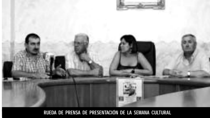
RUEDA DE PRENSA DE PRESENTACIÓN DE LA SEMANA CULTURAL