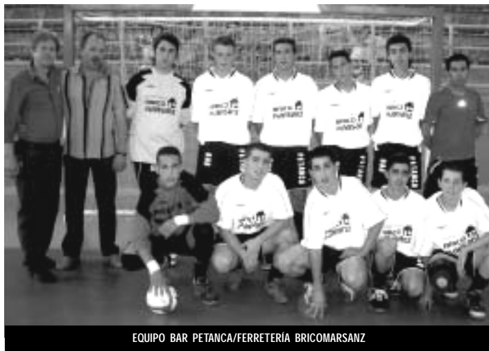
EQUIPO BAR PETANCA/FERRETERIA BRICOMARSANZ