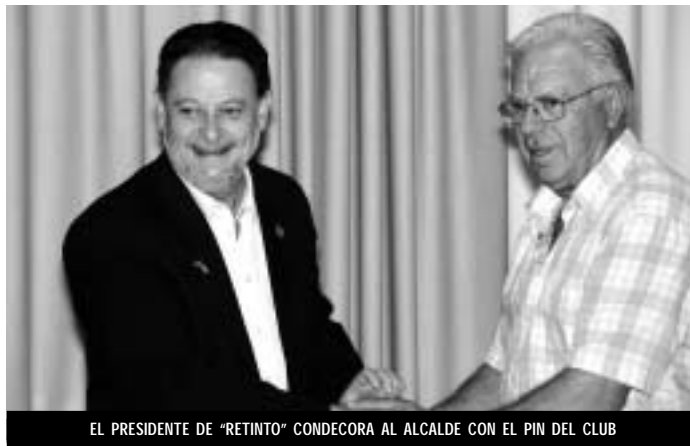
EL PRESIDENTE DE "RETINTO" CONDECORA AL ALCALDE CON EL PIN DEL CLUB