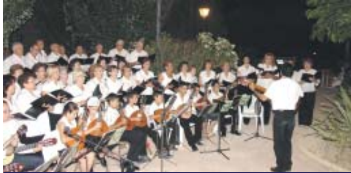
IMAGEN DEL CONCIERTO INAUGURAL, EN EL PARQUE DE DOÑA MAXI

La exposición cerró sus puertas el jueves 26 de julio.