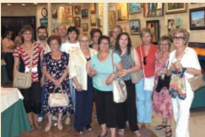
EL PROFESOR Y LOS ALUMNOS DE PINTURA Y MANUALIDADES