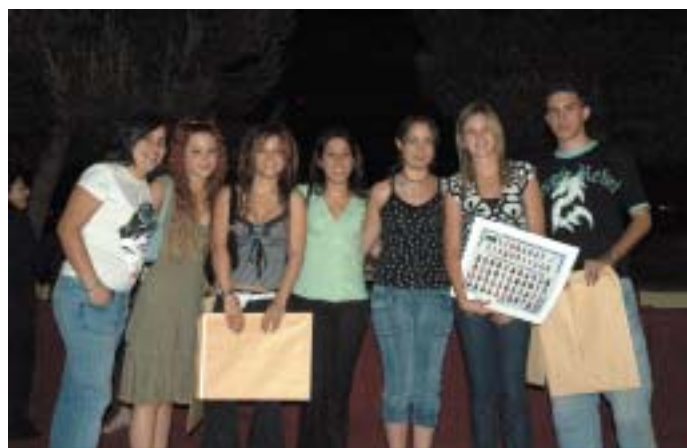
ALGUNOS DE LOS ALUMNOS, CON SUS DIPLOMAS Y ORLAS

Entre los actos de clausura del curso lectivo en el Instituto de Enseñanza Secundaria de Pinoso se incluyeron varias representaciones teatrales, entre las que destacamos "Patinant", puesta en escena por el Taller de las Artes Escénicas Municipales, en colaboración con el Instituto. Bajo la