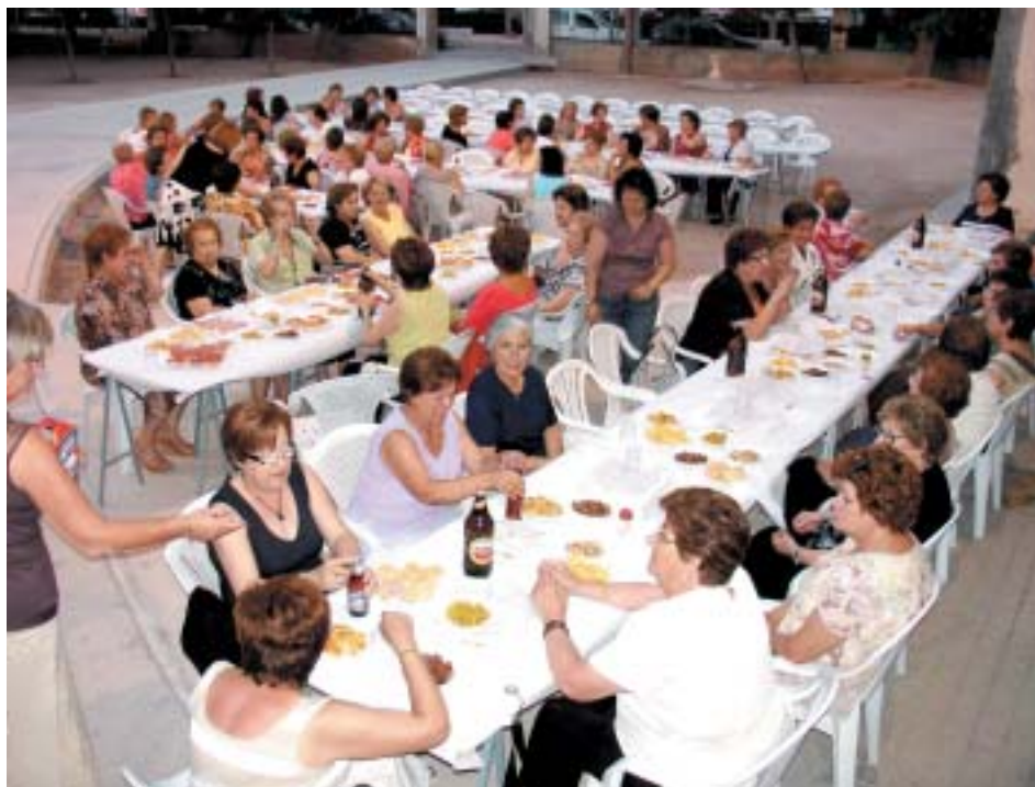
ASISTENTES A LA MERIENDA-CENA CON LA QUE LA ASOCIACIÓN DE AMAS DE CASA CERRÓ EL CURSO

Tras el paréntesis veraniego, la asociación local reanudará sus cursillos y actividades en el mes de septiembre.