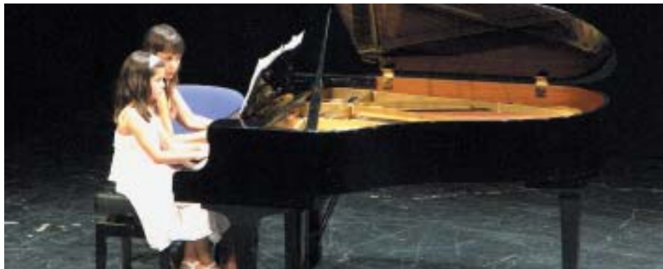
INSTANTÁNEA DE LA AUDICIÓN DE PIANO

En algunos casos, las audiciones sirvieron a los alumnos como ensayo general de la fase local del Certamen de Interpretación Musical Comarcal, celebrada durante el mes de julio.