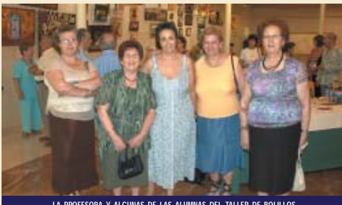
LA PROFESORA Y ALGUNAS DE LAS ALUMNAS DEL TALLER DE BOLILLOS

A lo largo de todo el mes de julio, el Centro de Recursos "Casa del Vino" acogió una interesante exposición de las Escuelas Municipales de Pintura y Manualidades.