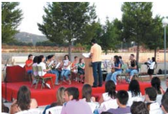
LA FIESTA FIN DE CURSO COMENZÓ CON UN CONCIERTO A CARGO DE ALUMNOS DEL CENTRO