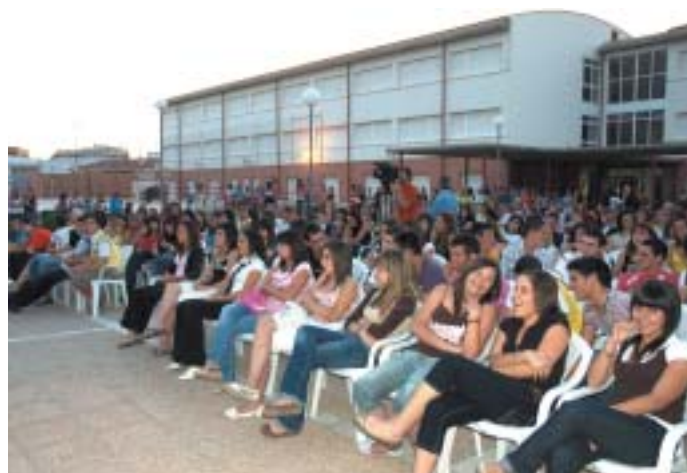
LOS ALUMNOS QUE ESTE AÑO ACABAN EN EL INSTITUTO OCUPARON LAS PRIMERAS FILAS

El Instituto de Enseñanza Secundaria "José Marhuenda Prats", celebró en la jornada del jueves 28, y en el propio centro educativo, un acto con el fin de celebrar el final del curso 2006/2007.