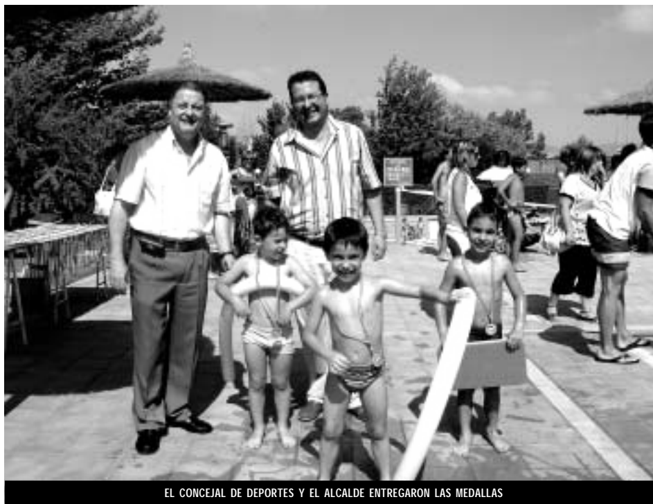
EL CONCEJAL DE DEPORTES Y EL ALCALDE ENTREGARON LAS MEDALLAS

Al término de cada turno infantil, los alumnos demostraron su destreza y fueron obsequiados con un detalle por parte del Ayuntamiento.