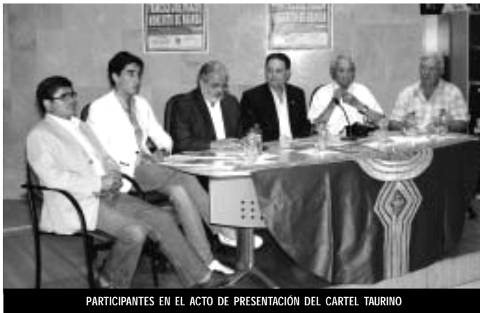
PARTICIPANTES EN EL ACTO DE PRESENTACIÓN DEL CARTEL TAURINO

El Centro de Recursos "Casa del Vino" fue escenario, el pasado 29 de junio, día de San Pedro, del acto de presentación del cartel de la corrida de toros a celebrar en la tarde del domingo 29 de julio. Esta presentación se enmarcó dentro de los actos del décimo aniversario de la fundación del Club Taurino "Retinto" de Pinoso. Para ello, se organizó una semana cultural, que se inició precisamente con este acto, en el que se obsequió, con pins conmemorativos, a los alcaldes y presidentes que durante estos 10 años, han estado, dando soporte al club.