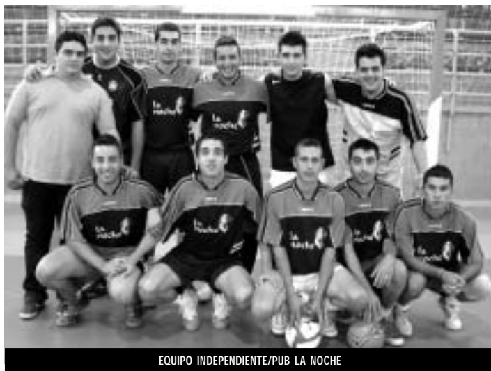
EQUIPO INDEPENDIENTE/PUB LA NOCHE

Tras dos meses de intensa competición, el 28 de julio se disputa la final del Torneo de Verano de Fútbol Sala, en el que han tomado parte diez equipos. Las instantáneas que acompañan esta sección muestran algunos de los equipos que han participado y participan en el torneo.