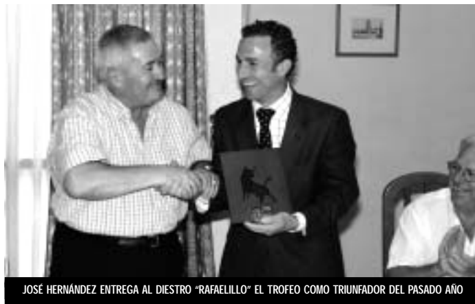
JOSÉ HERNÁNDEZ ENTREGA AL DIESTRO "RAFAELILLO" EL TROFEO COMO TRIUNFADOR DEL PASADO AÑO

Tras el café, se celebró un coloquio con el maestro "Rafaelillo", en el cual los aficionados le pudieron realizar diversas preguntas sobre su carrera, así como la utilización de diversas técnicas del toreo.