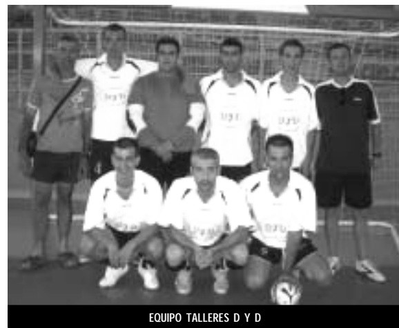
EQUIPO TALLERES D Y D