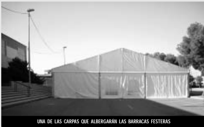
UNA DE LAS CARPAS QUE ALBERGARÁN LAS BARRACAS FESTERAS

Este año, la juventud vivirá las noches festeras en los alrededores a las zonas deportivas. Las Concejalías de Seguridad Ciudadana y Fiestas han unido esfuerzos para que se logre el cambio de ubicación de barracas, evitando las molestias que su actividad origina a los vecinos del casco urbano.