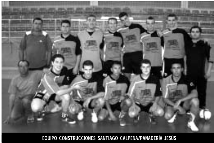
EQUIPO CONSTRUCCIONES SANTIAGO CALPENA/PANADERIA JESÚS