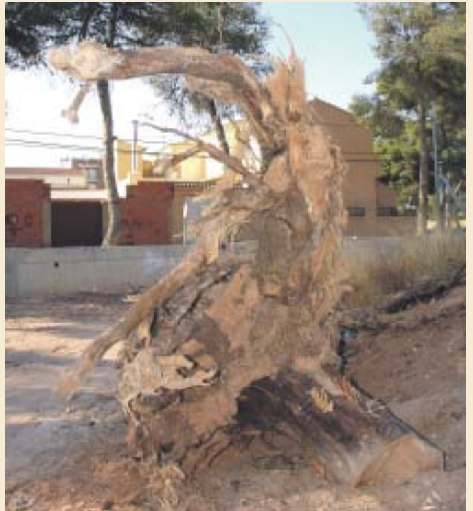
BASE Y RAÍZ DE UNO DE LOS PINOS SECOS DEL BADÉN

Durante los próximos meses, transcurrida la época estival, se llevarán a cabo las actuaciones pertinentes en aquellos ejemplares que lo precisen.